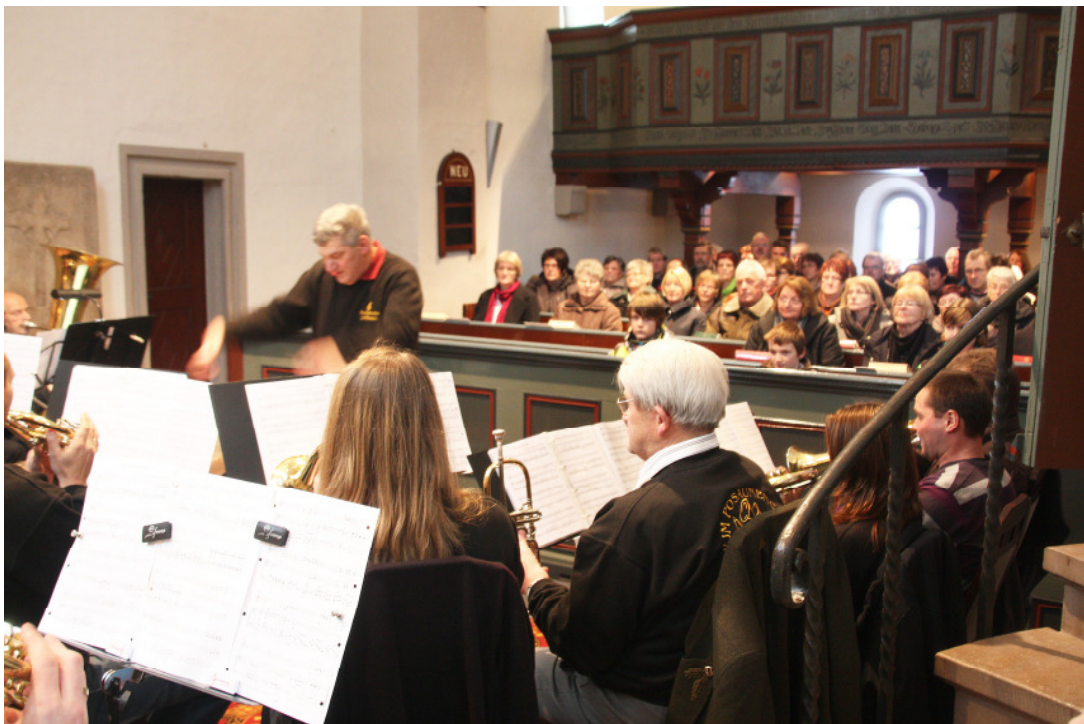
Zahlreiche Zuhörer genossen den Posaunengottesdienst am 16.12.2012