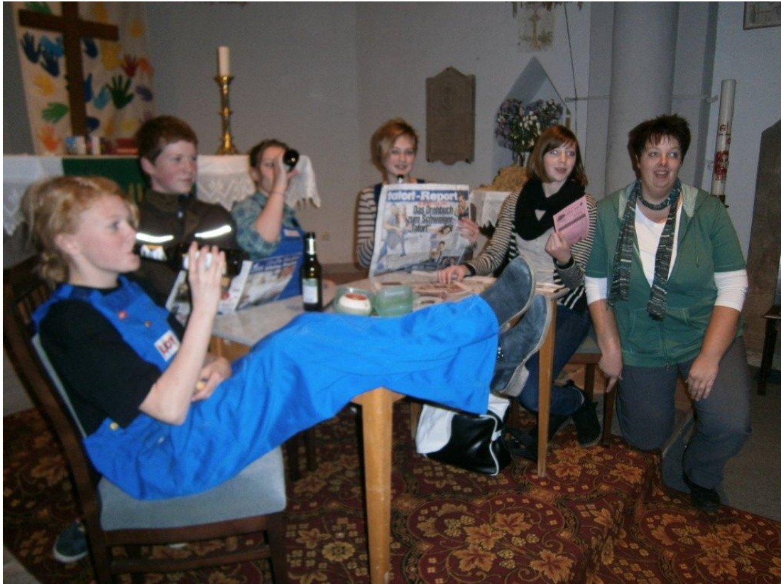
Der Jugendgottesdienst am 27.10.2012.

Alles in Allem ein gelungener, etwas anderer Gottesdienst, an dem alle Beteiligten mit sichtlich großer Freude bei der Sache waren und der wesentlich mehr Besucher verdient hätte.