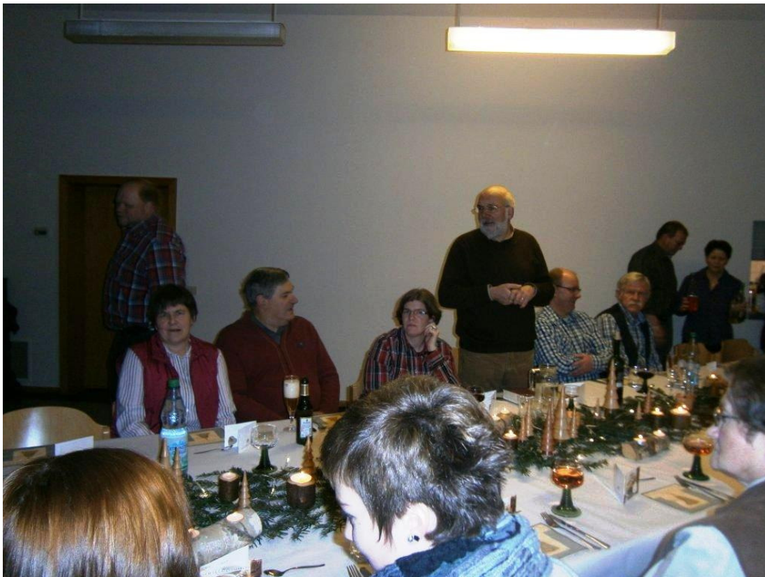
Bei der Weihnachtsfeier am 29.12.2012