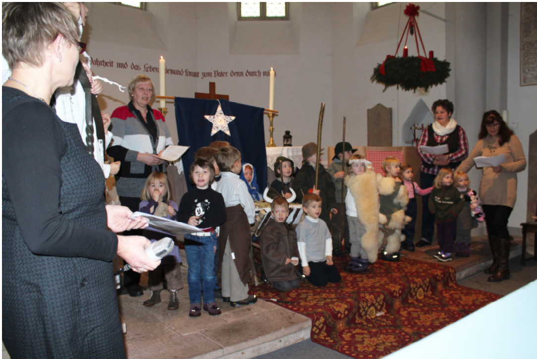
Der Kindergarten Zwergenland mit seinen Kindern und Mitarbeiterinnen beim Gottesdienst am 02.12.2012.

Der erste Advent wurde eingeläutet durch ein Krippenspiel, aufgeführt von den Kindern des Kindergartens Zwergenland. Es hat einfach nur Spaß gemacht, die Begeisterung der Kleinen zu erleben. Maria und Josef und alle anderen waren schlichtweg umwerfend, das „Ihr Kinderlein kommet“ wurde mit so viel Inbrunst gesungen, dass es eine wahre Freude war. Ließe sich doch ein bisschen von der Unbefangenheit und Natürlichkeit der Kinder auf uns Erwachsene übertragen, vielleicht wäre das Leben etwas entspannter. Kinder sind Leben und Kinder sind Zukunft – auch die der Kirche.